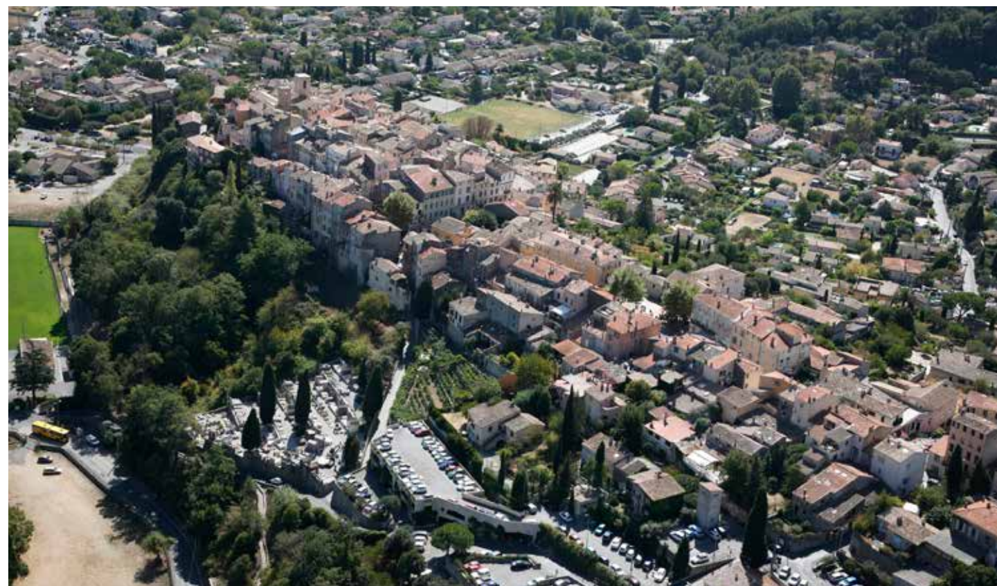
Vue aérienne de Biot