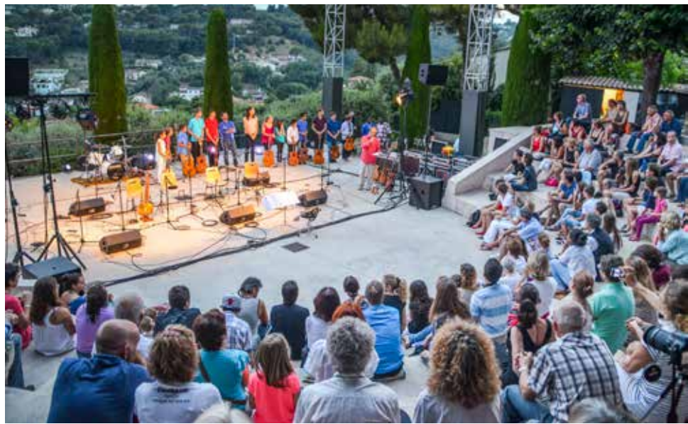
Les concerts au Jardin F. Mistral

La Municipalité souhaite mettre en œuvre une politique culturelle ambitieuse destinée à animer Biot tout au long de l'année. Afin de rendre la commune attractive l'équipe municipale souhaite également tisser des liens avec les acteurs économiques du territoire et favoriser l'installation de nouvelles entreprises pour dynamiser l'économie locale. Enfin, pour garantir la stabilité financière, une gestion maîtrisée des finances communales est mise en place.