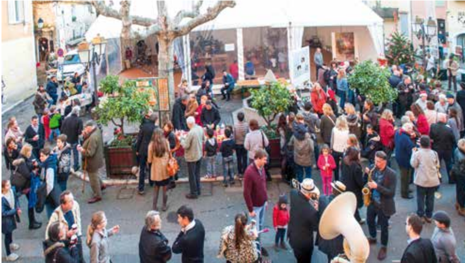
Reflets de Noël

Comme annoncé dans la Lettre du Maire d'octobre 2014, l'équipe municipale fait de la culture et de l'événementiel un des piliers de l'attractivité de la commune. L'animation de Biot toute l'année, cet engagement pris par le Maire dans son programme électoral vient soutenir le développement économique de la ville et plus particulièrement celui du village. La programmation s'appuie sur 4 grands axes : l'identité de la ville, la culture scientifique, la musique et la citoyenneté.