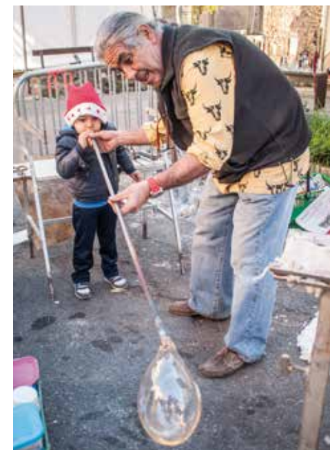
Atelier de soufflage du verre - « Reflets de Noël »

C'est en ayant conscience des impacts économiques de sa politique culturelle et événementielle que l'équipe municipale souhaite recueillir les retours et avis des acteurs économiques pour avancer ensemble vers un objectif « gagnant-gagnant ».